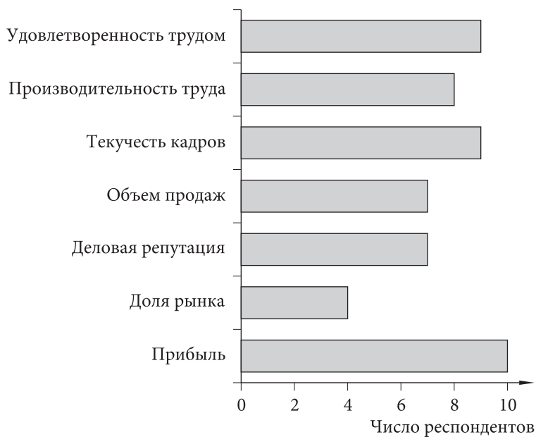
Рис. 3. Влияние функции УЧР на показатели деятельности организации