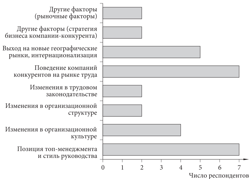
Рис. 2. Факторы, влияющие на выбор и изменение стратегии УЧР